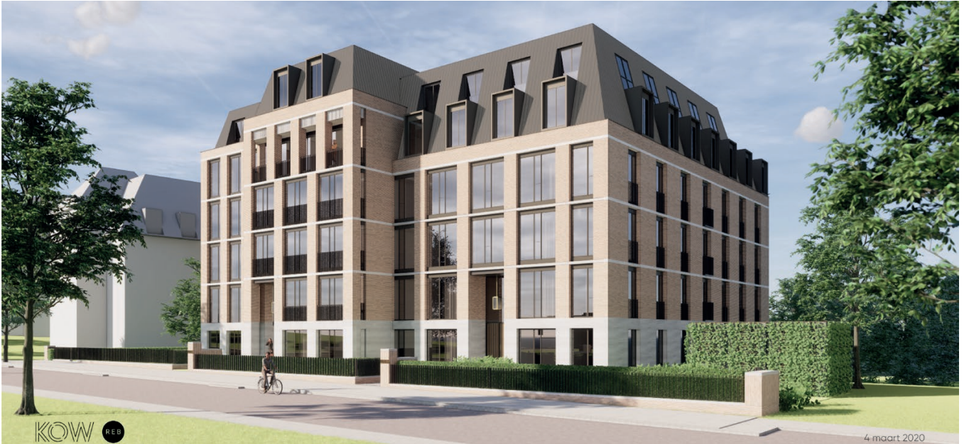
Voorgevel bouwaanvraag Duinweg 35