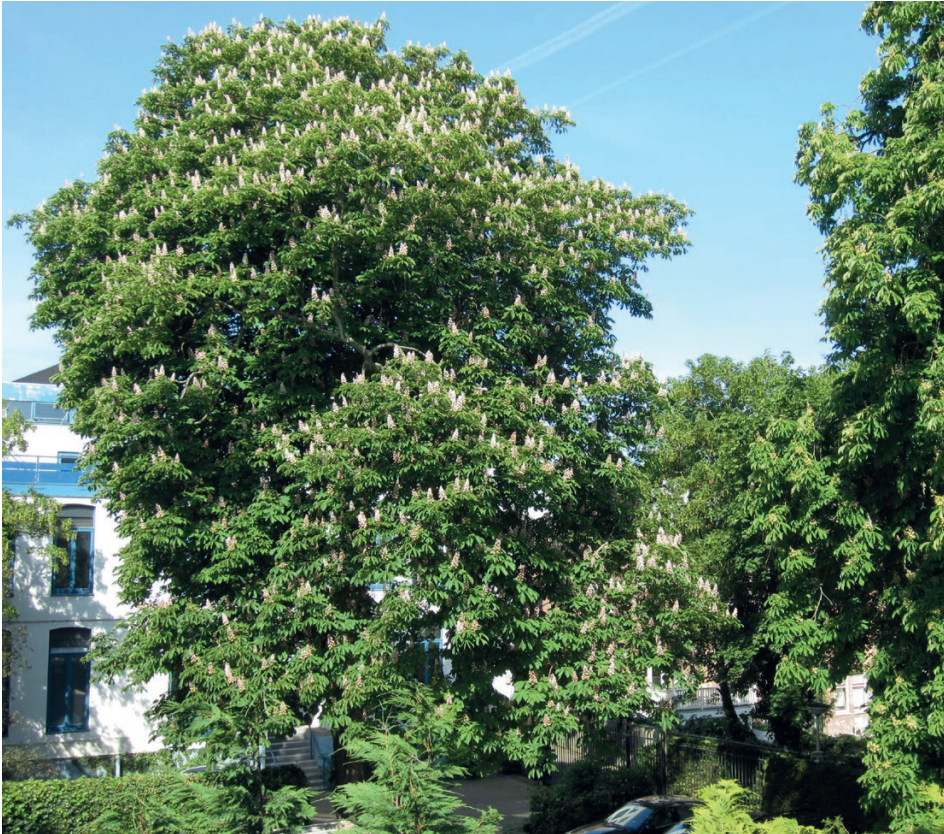
De fraaie kastanje achter de Iraanse ambassade.