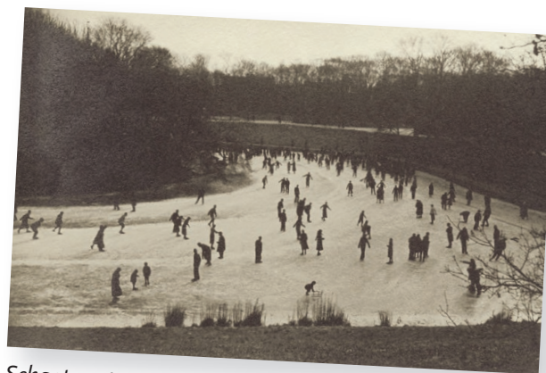
Schaatspret anno 1921.