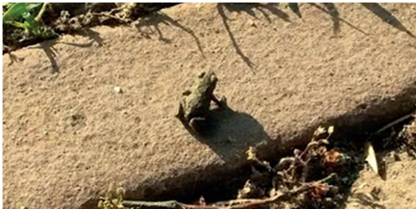
Padje op weg uit de vijver

Bomen moeten volgens de geciteerde onderzoekers uit Wageningen vooral ook zelf gezond oud kunnen worden. 'Volwassen bomen hebben immers een veel groter effect dan jonge pas geplante bomen. Dit vereist een juiste standplaats voor elke soort boom en voldoende groeiruimte. En het is belangrijk om voor een spreiding van boomsoorten te zorgen. Dit is niet alleen goed voor de biodiversiteit, maar verlaagt ook de risico's op ziekten en plagen.'