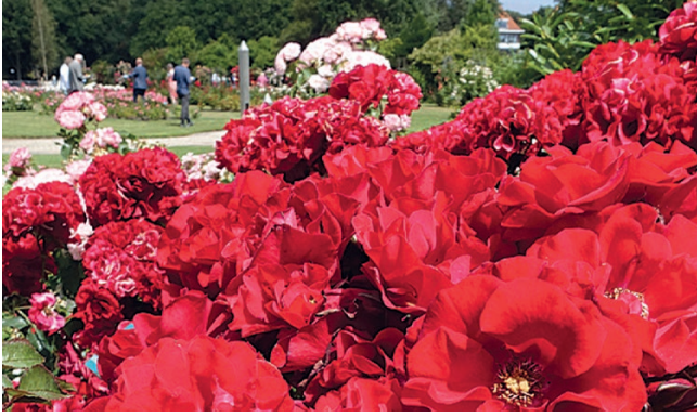
Publieksprijs 2018 'Roter Korsar', trosroos, Kordes

Zij worden dan gekeurd door een internationale keuringscommissie. In verscheidene categorieën kan een gouden medaille worden gewonnen.