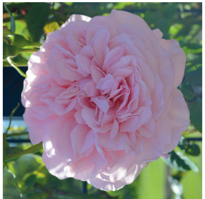
Uit het Rosarium 2020

Ieder jaar worden er behalve de keuring ook andere activiteiten georganiseerd rondom de roos. Vroeger vonden die plaats een of twee dagen na de keuring; vorig jaar waren die op de dag van de keuring zelf. Er zijn dan kraampjes van groene verenigingen en de Nederlandse Rozenvereniging; er is een workshop bloemschikken, een plantendokter, high tea, muziek in de sfeer van het rosarium en andere vrolijkheden in het kader van de roos. Volgend jaar is het concours – hopelijk – weer terug in het rosarium.