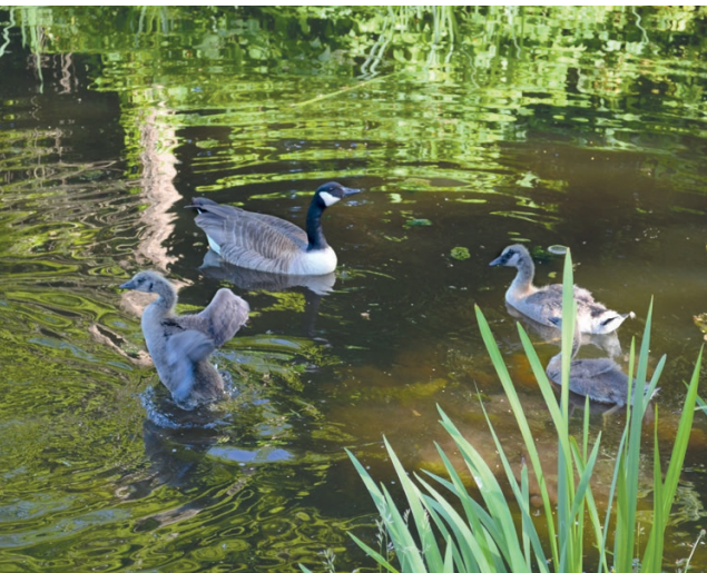
Gans met jongen in water Westbroekpark