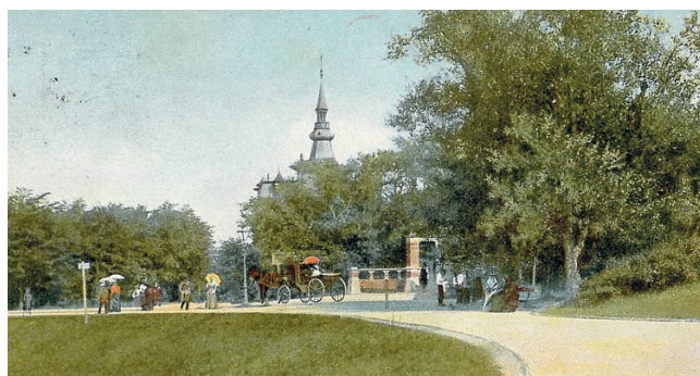
's-GRAVENHAGE Gezicht op de Cremerbank Uitsicht 9 Aug Dr. Trenkler Co., Leipzig. 15461 Nachdruck verboten.

Ook anno 2020 is het aangenaam toeven rond de Waterpartij en kan eenieder naar hartelust lange wandelingen onder weelderig lover maken en zich verpozen op bankjes langs de Waterpartij.