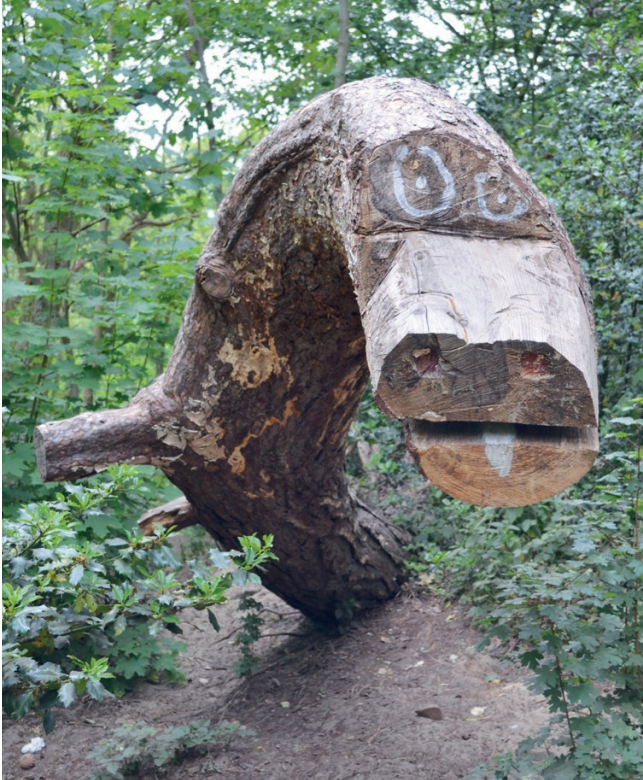
vrolijke draak Belvédèreduin

In het kader van duurzaamheid zijn de wijken en de gemeente druk bezig met de energietransitie. Wat valt daarover te melden? Onze wijk heeft een projectplan ontworpen met drie andere wijken. De gemeente maakt het Ontwerp Stedelijk Energieplan.