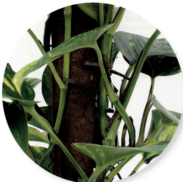
Plant met mosstok

Na een proces van experimenteren, testen en bijschaven ontstond er na iets meer dan twee jaar een nieuw eindproduct ter vervanging van de oude mosstok. Deze nieuwe bio composteerbare klimstok