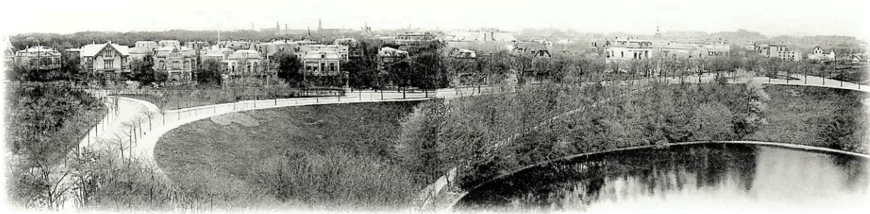
De Hogeweg anno 1900. Uitgave H.S. Spielman, Amsterdam 2049. Collectie auteur.

tekst en beeld: Anneke Landheer-Roelants/collectie auteur