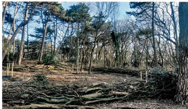
Bosonderhoud het Haagse Groen

De gemeente verstrekt ook online informatie over het beheer van de Scheveningse bosjes. Een leuke informatiebron om af en toe naar te kijken is: https://hethaagsegroen.nl/scheveningsebosjes