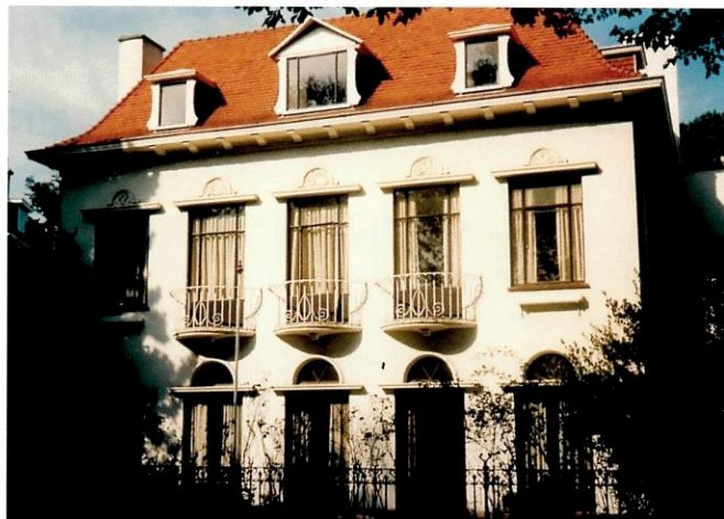
Hogeweg 4 in 1987. Villa Esmeralda in 1906.

Op 3 november 1944 stortte een V 2 neer op Huize Parkweg, het door de Stichting Ons Thuis geëxploiteerde bejaardentehuis aan de Parkweg 4, 6 en 8. Veel huizen in de omgeving lopen oorlogsschade op. Zo ook Hogeweg 4, dat zwaar beschadigd wordt door inslag aan de achterzijde. In feite is wat er van de villa overblijft niet meer dan een ruïne. Besloten wordt tot herbouw, naar een ontwerp van het architectenbureau Blankenspoor & De Vries. Herbouwd zal worden met hergebruik van de muren van de benedenverdieping. Het resultaat is een fraaie villa in wederopbouwstijl met als bekroning van de ramen op de eerste verdieping