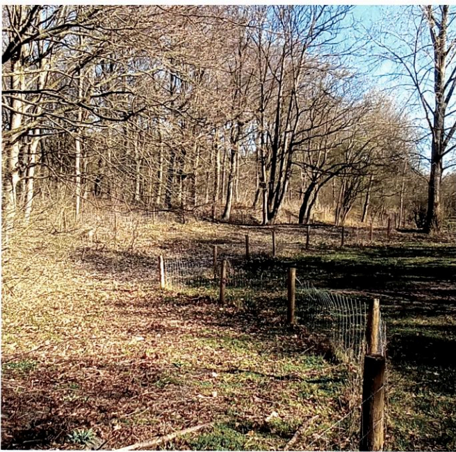
Mantelzoom met haags melange